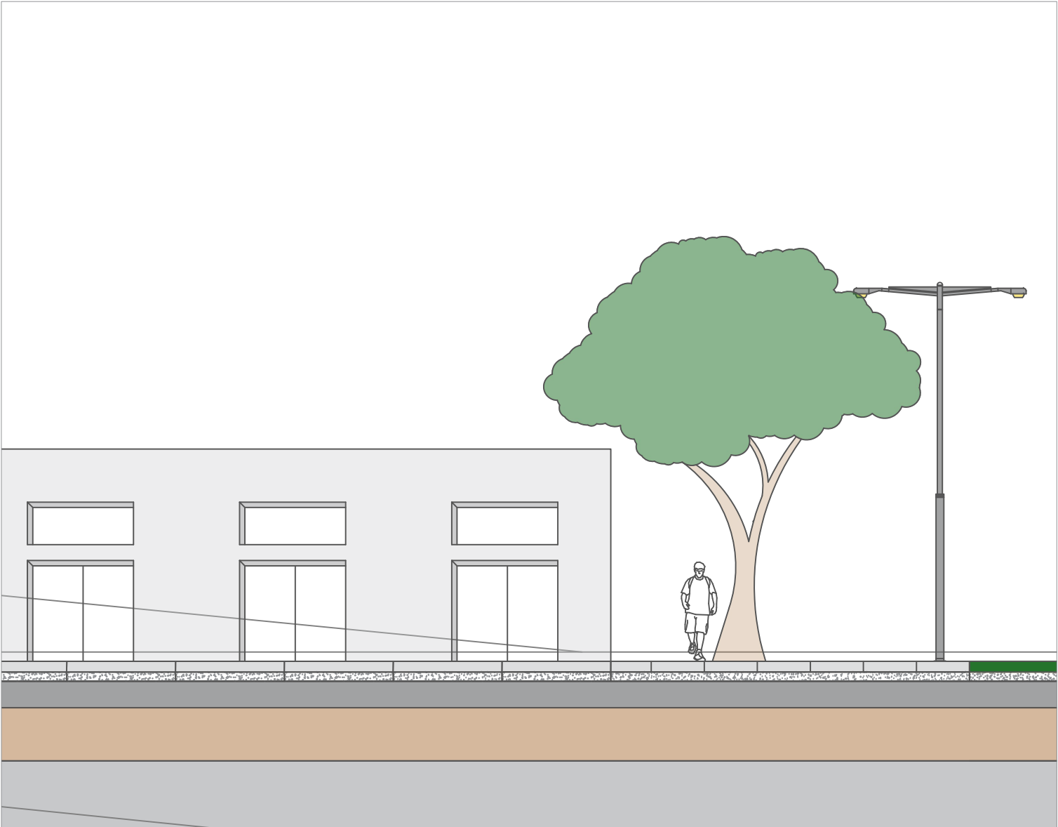
DETALHE 02 - COMÉRCIO