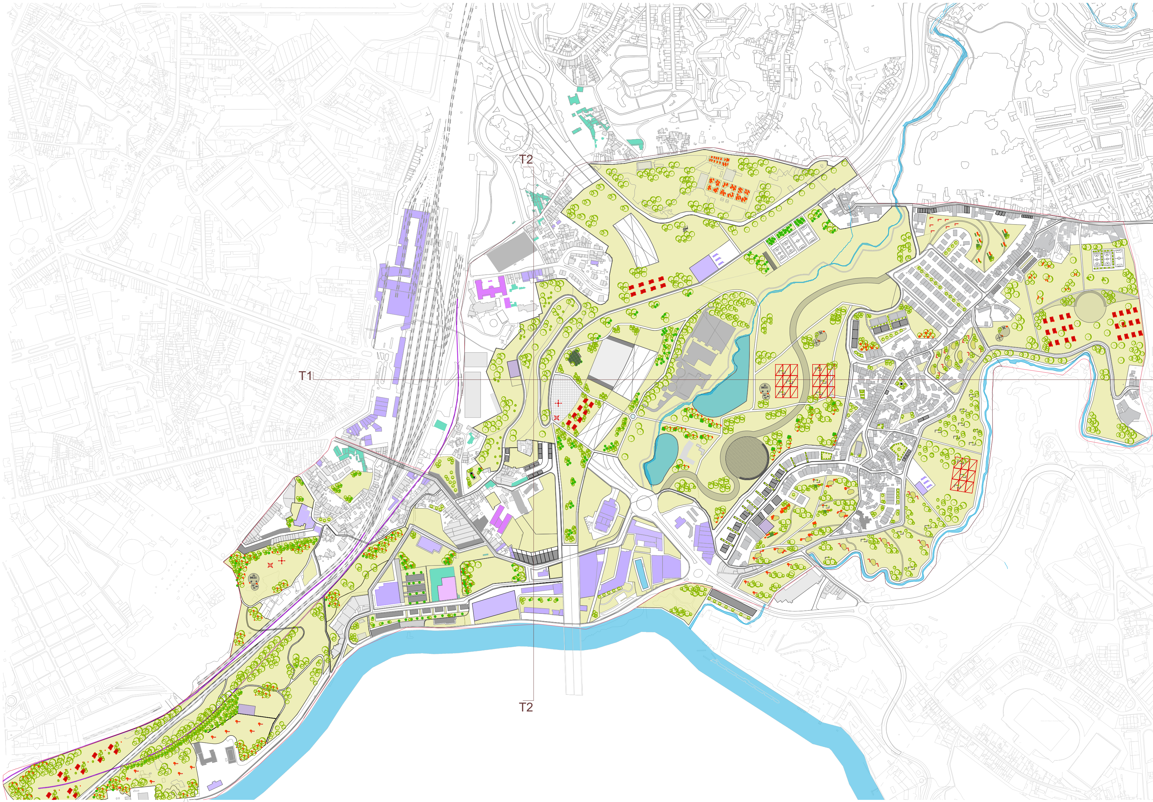
UOPG | PAISAGEM E TERRITÓRIO